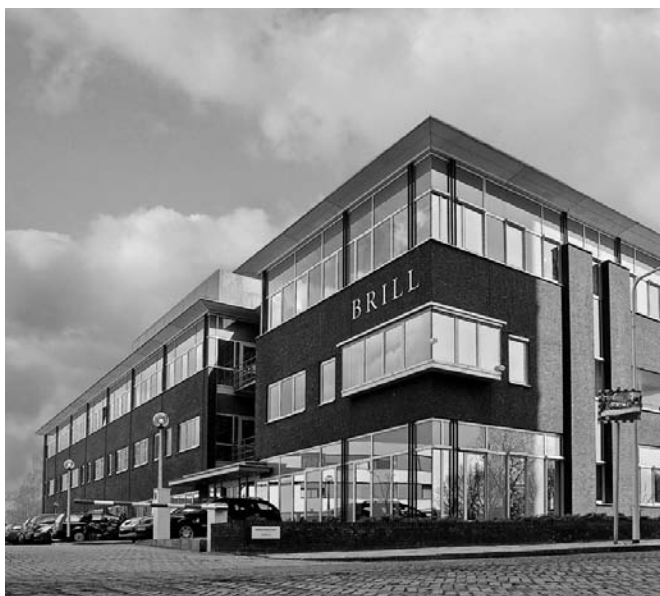
Het huidige pand van Brill te Leiden

'Het eerste product dat we nu willen bereiken is een PDF of XML-bestand. Van daaruit doen we de distributie, hetzij digitaal, hetzij gedrukt. Maar dat wil niet zeggen dat er geen boekarchitectuur onderligt. Wat het lastig maakt, is dat je vroeger tegen je uitgever zei, ik beoordeel je op het aantal verkochte exemplaren. Nu gaat het om iets vaags als "de verspreiding van de content". Maar uiteindelijk moet de lezer toch bepalen hoe die het best van de informatie gebruik kan maken. Je moet daar liever geen eigen targets bij stellen. Het hangt af van wat de gebruiker wil. Maar je moet er wel klaar voor zijn, en dat zijn we: met businessmodellen, marketing, distributie, rechten, contracten, de productie in XML, de hele boel. Daarmee is onze kwetsbaarheid verkleind.'